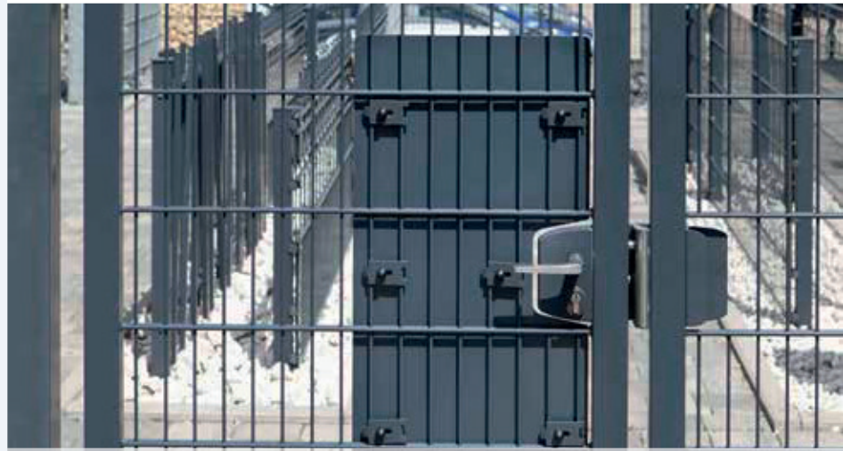
Durchgreifschutz-Set inkl. Zubehör